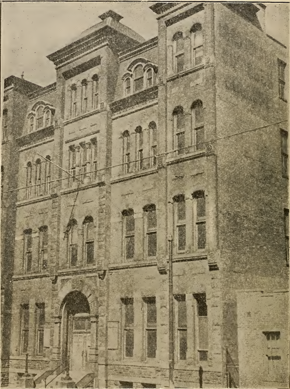
דער בנין פון דעם „בית-יעקב“ לערערין סעמינאר און היי סקול אין אַמעריקע Beth Jacob Teachers Seminary and High School of America