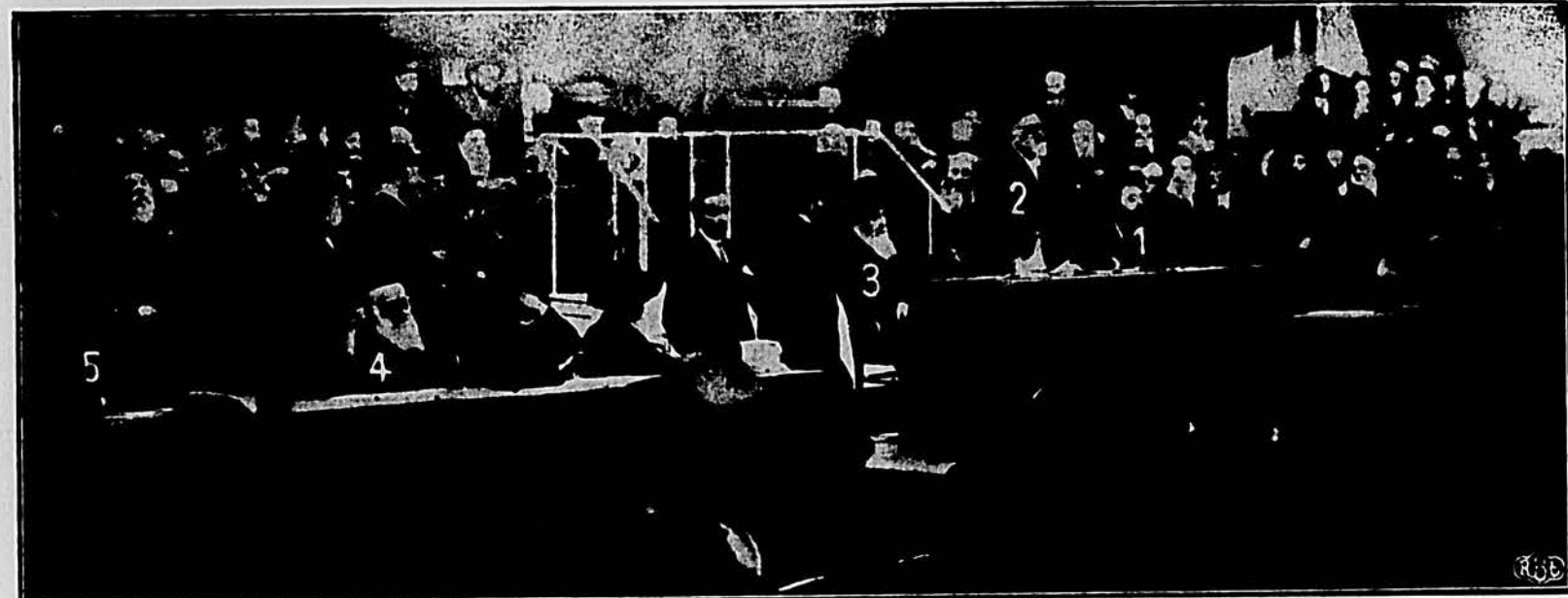
(1) הרב יצחק מאיר לעווין, (2) הרב דר. פנחס קרן, (3) הרב יעקב ראזנברג, (4) הרב יהודה לייב צירלעוואן, (5) רבי בערעניו פרידמאן (דער זון פון שטראסקאווער רבי)