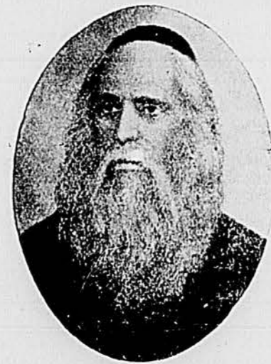
(דון יצחק אברבנאל)

Gdzie z jedno słowo o obowiązkach względem czynnego, wręczego działalnością życia? — Wreszcie —