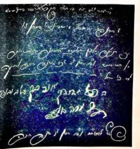
מכתב בכתב יד קדשו של הרבי ר' בונם מפשיטא

אולם. כאשר יקדו יזומו של השעה באב' יחול בשבת יקדש — אזי השבת נהגת באופן אחר לחלוטין. עצבות והן מנהל ל' תחזיקו לתוך פמלתינו — זה נחפה השבת באומו אורח בלתי קרוא אשר בסי' ס' באב יתנה — זה כשום אופן לא ולא! אין לך דריסה רגל אצלו. אין לך שום נכיות ארע בשבת, ואין לך עצנת אחרת אפס — להודוה למחרת היות" והאיש שיהיה שרוי כל ימיו ב' עצבות הכין זיטב את המשל ה' ברבע זה של חוסרת הסכנה.