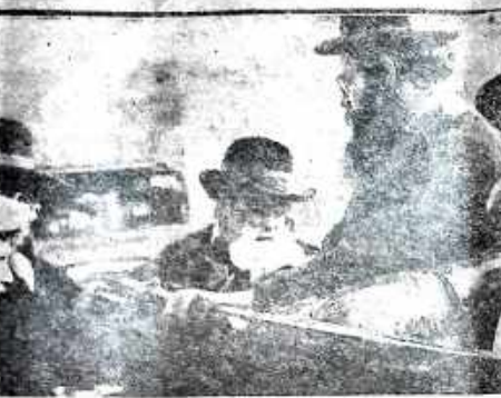
הרב יצחק מאיר לוין תחת רבי נשיאה, שנתפחה אל האדמורי דגל ספר, ברובו לארץ-ישראל - צילום זה נעשה בחצות היום

כמה ז"ל נעלה הכפי האומה, וה' יסלוק ערדו! הנה הרוב של כל מה שהיה בסדר אלפיים השנים האחרונים, כחובו את מערכת היחסים המודרניים את כל שסוף היום, כל קובץ, יורה דעה - את דמות ה' הדין, שיק אדם לחבר, אכן הצדק - את מרית חיי המספחה, והארה חיים - את חיי היום יום והתגו ומשני ישראל, הפעלים את היתורים והתקופות בשם עילאית.