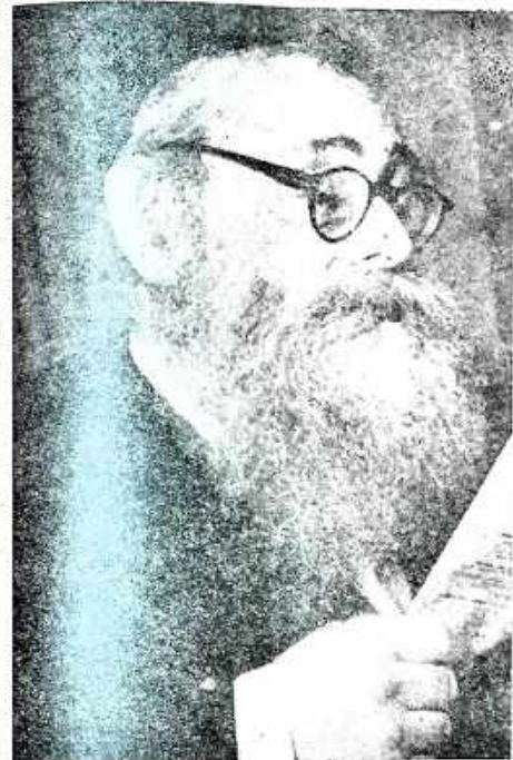
המונהיג בעצרת התקופה נשיא אגודת ישראל המלומד הרב יצחק מאיר לוין ז"ל

החוקה היא המסמך המשפטי המבטיח את השלום והאחדות בין בני העם. היא היא המסמך המשפטי המבטיח את השלום והאחדות בין בני העם. היא היא המסמך המשפטי המבטיח את השלום והאחדות בין בני העם.