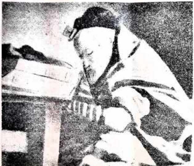
תורה ותפלה בשעת אחד

תמונה נדירה של החפץ חיים ועל שפנותיו האחרונות