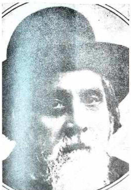
הגאון ר' מאיר שמחה אשר 40 שנה יושב על כס הרבנות מדווינסק

אמיתיה של תורה רבי מאיר שמחה מדווינסק, מחבר ספרי "אור שמח" על הרמב"ם והפוסק המובהק של הדורה, היה יותר מיושב שנים וזה ששמו בארץ-ישראל מיוסי וזו היה חוסס יריבה בלבן המקובל, וארבעים שנה ששם את ישראל ב' וקצו עשרים ושש שנה תורתה, אבל שמו הלך לפניו בכל יריבה ליטא.