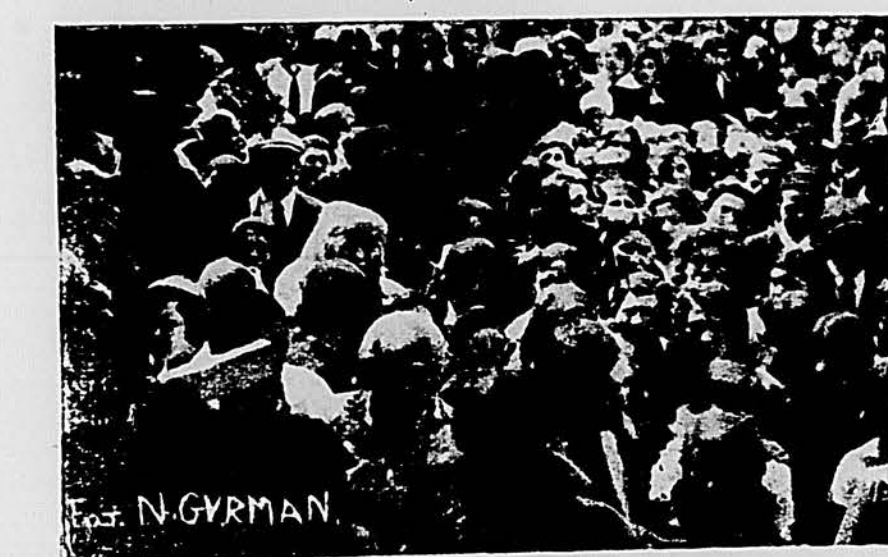
בנות-חברות ביי דער חגיגה

ביים איבערשניירן דאס פאנד אריינגייענדיק איינס בנין. 1) ראשי-תון און פרנס א. ב. עסקא-און 2) דורכשטאר וואל אונגער 3) דער דיוגאשאדלע רב 4) ספק-שטאר און אונדזער צענטראלע יחזקאל ראשי-תון.