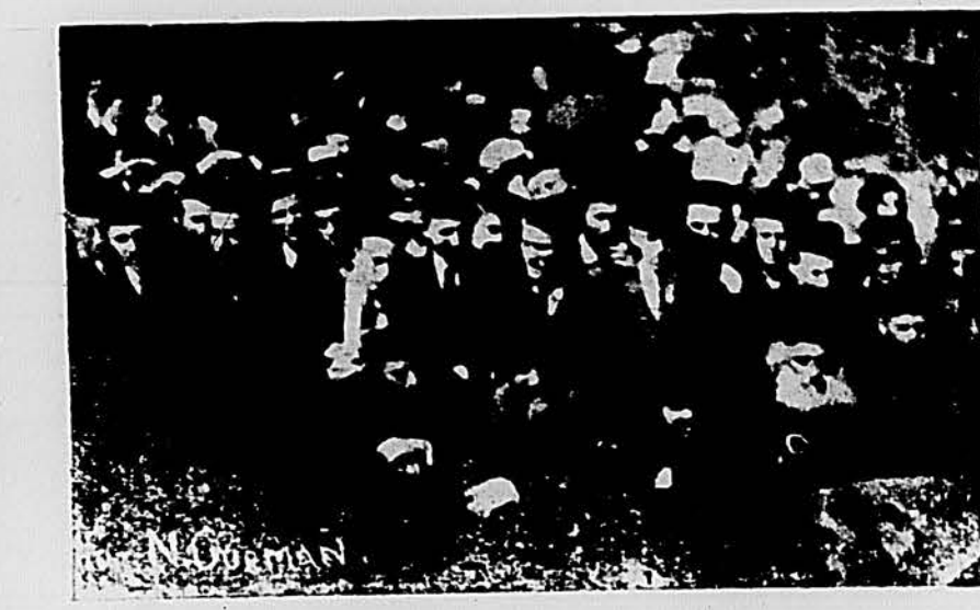
רבנים און געסט ביי דער חגיגה

שטארק איז גיווען די באטייליקונג פון אונדזער יוגנט אין דער שמה. פון אלע שטעט און שטעטלעך ארום זענען גיקומין די בנות און צעירים. יא, די יוגנט פארשטייט דאס חשיבות פונעם פארוארנן אונדזערע קינדער מיט א ביסל פרישער לופט.