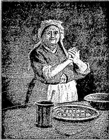
קינדלעך יכבוד פסח...

משפּחה, ווערט דורך איר קינסטלערי - שער באַצי- רונג אַנציענד און וײַער שראַק באַ- טראַכט ביים סדר - טיש, אזוי דאָס אַ אילוסטרירטע הגדה, גיט צו דעם סדר -