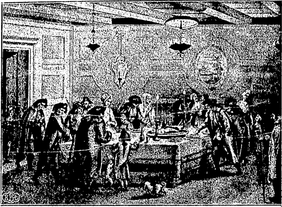
א סדר-נעכט אין רענעוויק

מען איז זיך משער איז די הגדה גישריפן גיווארן מיט בערך פיניף הונדערט יאָר צוריק. באַרימטע קינסטלער, וואָס האבן די