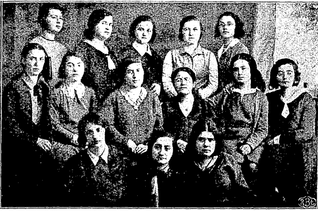
תלמידות פון בית-יעקב סעמינאַר אין ווין

און שטארקע ציגיבינדנקייט צו תורה, וואָס עס האט די גאַנצע בנות אגודת ישראל. איך וועל זיכער דערפרייען אלע חברות איבערגעבנדיק זיי אַפריילעכן גרוס פון ווין. כאַראַקטעריסטיש, איי-ראַפּא טוט נאך אייך, די בנות ישראל פון פוילישן יידנטום. אט איז דער בית-יעקב-סעמינאַר אין ווין. בעת דעם לעצטן ווינטער גיוואַרן אַ ציצואונגס-ארט פאַר צענדליקער יידישע מיידלעך פון מערב-איי-ראַפּע, וואָס וועלן זיין די גרינדער פון בית-יעקב און „בנות אגודת ישראל“.