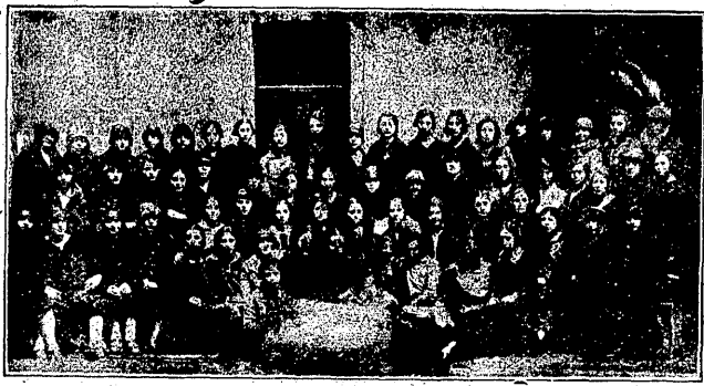
גרינדונג-קאנסערענץ פון בנות-אגודת-ישראל כ"ג אדר פ"ו

איך דערמאן זיך אינגאַנצן אַ פּאַר שטעטלעך גיווען פּאַרטערטן. אבער דער ריון-זאַל וואו ס-זענען גיווען פּאַרזאַמלט אַ קרוב טויזנט יידישע פּרויען און מײדלעך האט גיגעפן בטחון, אַז ס שאַפט זיך אַ גרויסע זאך. די עפנטלעכקייט חידוש-ט זיך דעמלט ווי אַזוי די פּאַרויערען, אַ גיבילדיטע יידישע טאכטער פון מערב-איראפּע מאַכט אַנ-הפּסקה צו מנחה-דאַווינין. דער עולם שטוינט און קען זיך גאַרנישט אַפּדערייזילן פון דעם „חידוש“ און באַלד