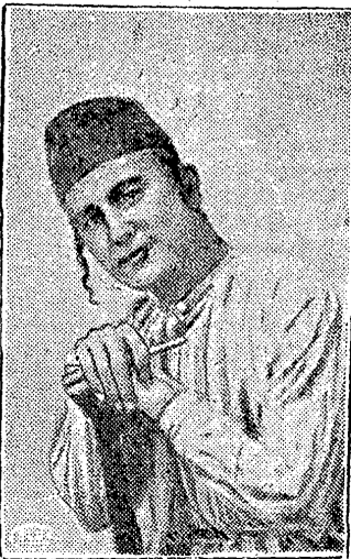
אַ טיפ פון אַ יינגין תימנער

שעהן לאַנג פּלעגט ער טיילמאַל ליגן אויף דער פּאַדלאַגע פאַר דער טיר פון שטיבל, איינגיקורטישט אין אַ פאַרמ-לאַזער קניף און זיך איינהערן אין די קולות פון די לערנער און דאווינער, און דאָס איז גיווען דער בעל-הבית? גיכער האט זיך אויסגיוויזן, אַז ער איז דער שמש, מ-איז שוין אַווי צוגיוואוינט גיווען, צו דעם, אַז טאמער איז עפיס נישט גיווען אין ארדינונג, האט מע זיך אויף אים גיביווערט און בשעת מעשה פאַרגעסן, אַז ער קען אַלע אַרויס-וואַרפן... חברה יונגוואַרל האט גימאַכט פון אים ליצנות, אַרויסציען וועלן מיר זיך, איז ער הכנעהדיק, ישטאַנן און גישמיכלט, ווייזנדיק בשעת מעשה די ווייסע ציין, ער האט זיך פאַרענטפּערט, ס-וועט שוין גוט זיין, שוין גוט זיין, נאר נישט זיך אַרויסציען, נאר נישט אַנטלויפן.