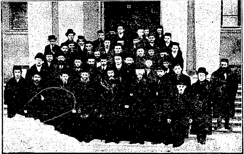
לאדזשער עסקקורסיע אין דער לובלינער ישיבה

די גידאַנקן זענען מיר וואו נישט ווען איבערגיריסן גיווארן, פון אַ שמועס מיט די עסקקורסאַנטן, הײַמישלעך, פּוילעך, תּוּוהדיק גישטימט איז אַדורך די נסיעה, אַ פאַר ענדעקישע סטודענטן, וואָס זענען צווישן אונדז אַרײַנגיפאַלן ווי יקניש אין סוכה", האבן גימורמלט צווישן זיך און אונדז דורכנישטאכן מיט זײַערע תּיהשע בליקן.