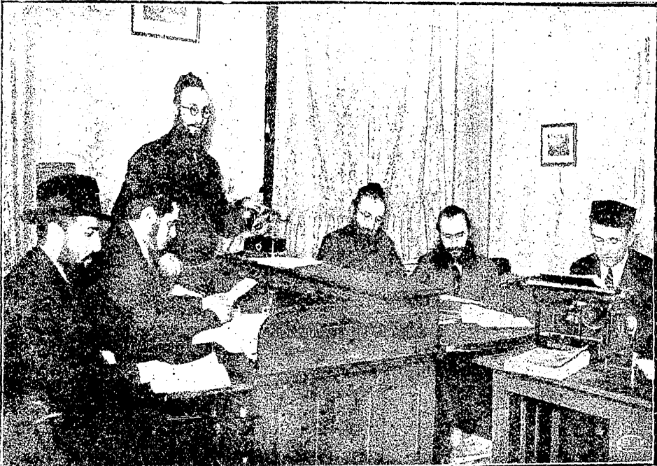
די רעדאקציע, בית יעקב, ביי דער ארביט

בית-יעקב-זשורנאל האט גימוזט געבן די ערשטע שורות ליינע-מאטעריאל. זיך פארשאפן ליטערארישע ארביטן און נישט גיווען פון וואס און פון וועמען צו נעמען. האט מין זיך גימאטערט, און ה'מאלי לייקינין, דאס זשורנאל איז נישט גיווען לייטיש, ליטעראריש בלאס און אן א פרצוף. יעדער נומער האט גיהאט